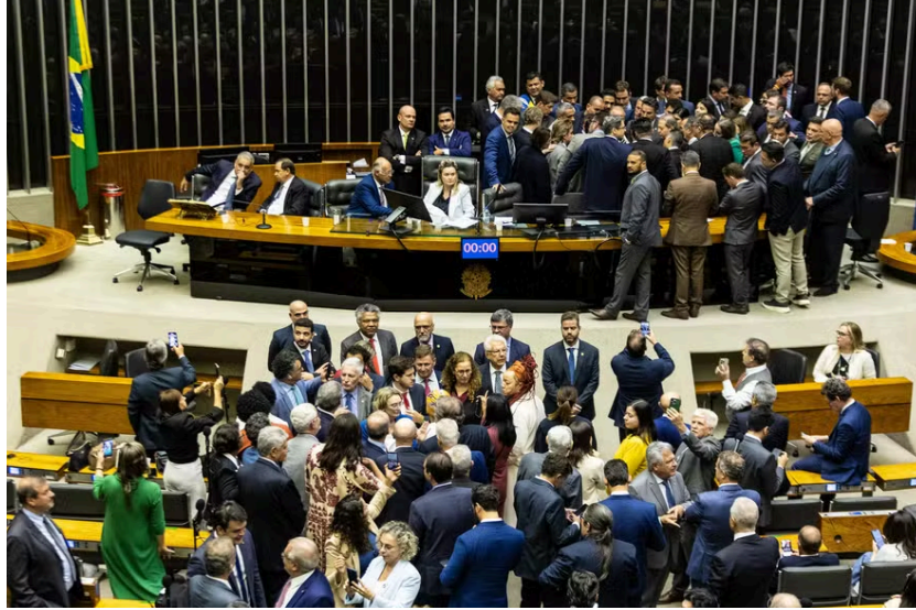
Figura 2: Deputados da oposição ocupam a Mesa da Câmara