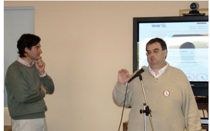
number of delegations